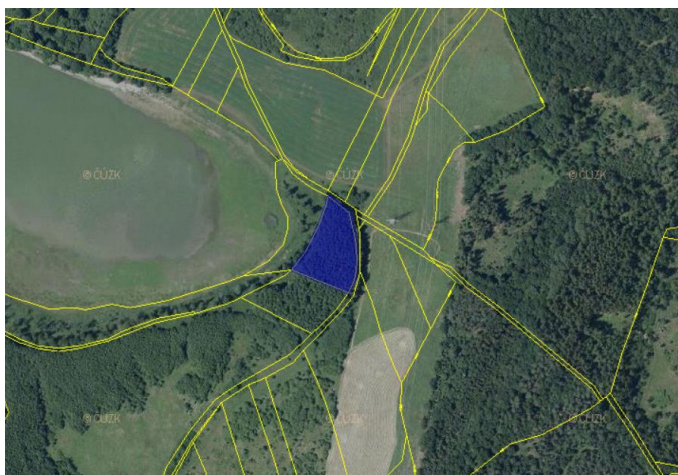
Obr. 1 Výřez katastrální mapy s vyznačeným lesním pozemkem, u kterého dochází k záboru

Změna č. 1 předpokládá zábor lesního pozemku parc.č. 882/2 v k.ú. Podbořanský Rohozec o rozloze 0,4 ha (4 240 m 2 ), který se nachází v ploše navrhovaného koridoru technické infrastruktury T01, který je veřejným zájmem vymezeným v ZÚR ÚK jako VPS. Koridor je navržen pro rekonstrukci stávajícího vedení, které je v současné trase vedeno existujícími lesními průseky na vedlejších pozemcích a do tohoto lesního pozemku tak nezasahuje.