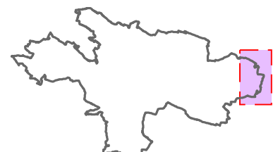
vyznačení části řešeného území změny č. 2