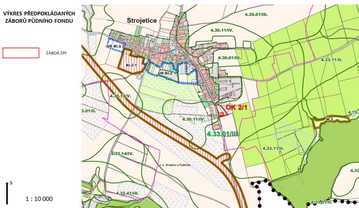
Obr 2: Výřez výkresu předpokládaných záborů půdního fondu (podklad: ÚP Chlumec)

Změna č. 2 respektuje stávající areály a objekty zemědělské výroby, nemá vliv na investice do půdy, uspořádání ZPF, na opatření k zajištění ekologické stability krajiny a schválené komplexní pozemkové úpravy.