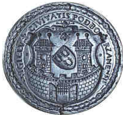
Vyobrazení 3: Originál historického pečetidla (obraz je zrcadlově převrácen)

Nejstarší dochovaná pečeť s vyobrazením erbu města je uložena v depozitáři Státního okresního archívu v Lounech. Ve stříbře provedená podoba pečetidla pochází ze 16. století. Opis nápisu v mezikruží pečetidla: „SIGILLV CIVITATIS PODBORZANENSIS“. Okraj pečetidla je zdoben vavřínovými listy, plochy kolem znaku jsou doplněny arabeskami.