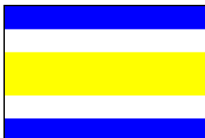
Vyobrazení 5: Schválená grafická podoba vlajky města Podbořany

Městskou vlajku (blason): tvoří list s pěti vodorovnými pruhy – modrý, bílý, žlutý, bílý a modrý v poměru 1:1:2:1:1. Poměr šířky vlajky k její délce je 2:3. Zobrazení městské vlajky bylo schváleno podvýborem pro heraldiku a vexilologii PS PČR a uděleno právo užívání předsedou PS v roce 1993.